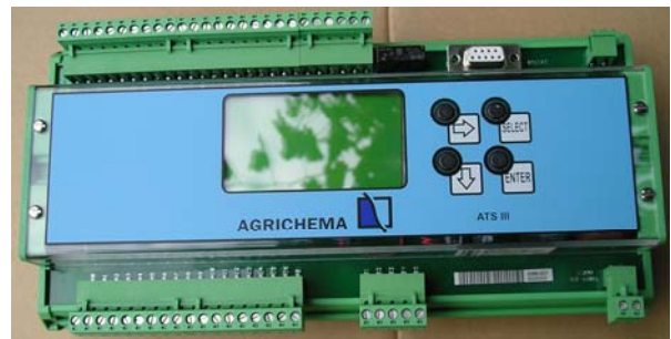
Abb. 2 Elektronik-Baustein ATS – III – PB - DP