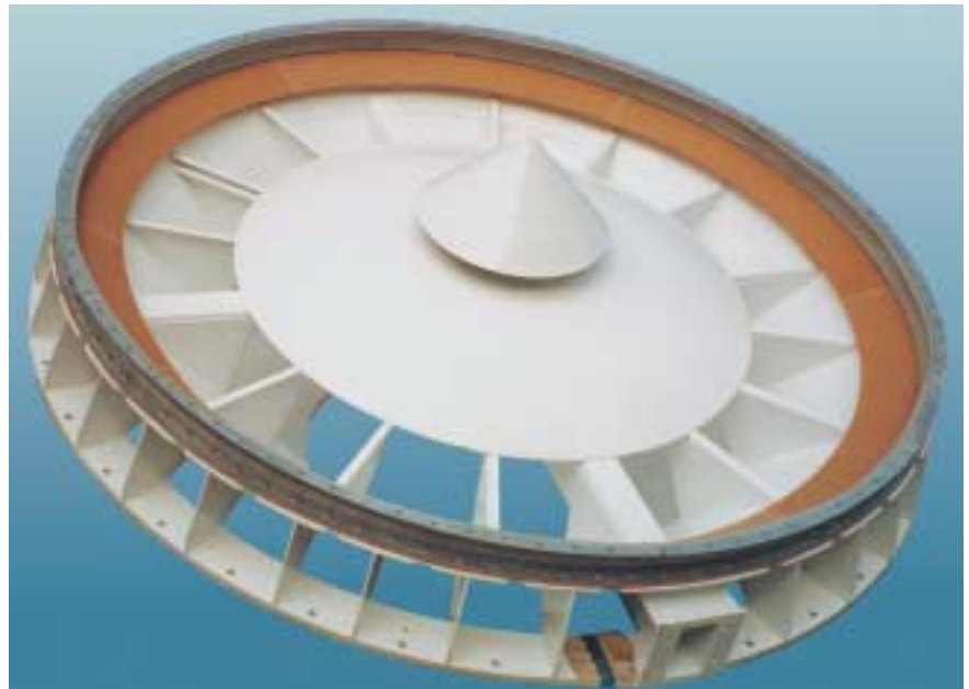
VIBOSTAR® VS 3500 in Sonderausführung

Der VIBOSTAR® Austragsschwingboden von AGRICHEMA ist ein in sich kraftschlüssiger Konstruktionkörper. Die fließtechnisch günstige Form wird im Rollwalzen-Umformverfahren hergestellt. Der VIBOSTAR® wird in Normalstahl oder Cr-Ni-Stahl gefertigt.